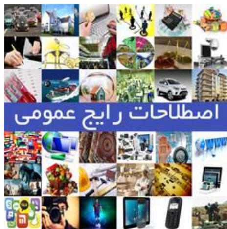
اطلاعات بیشتر و دریافت