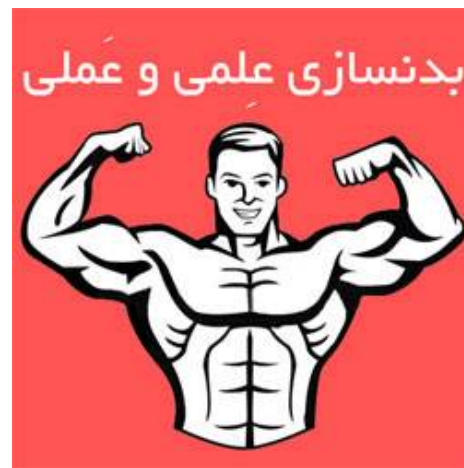
اطلاعات بیشتر و دریافت