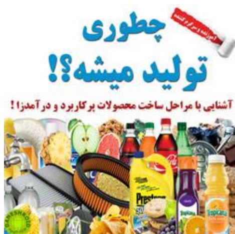
اطلاعات بیشتر و دریافت